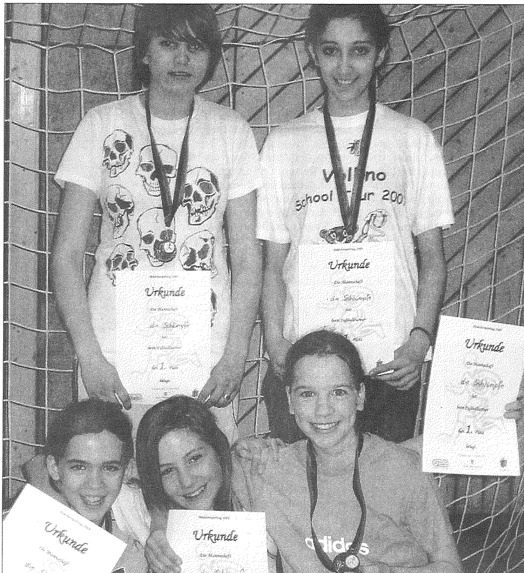
So sehen Siegerinnen aus: Das Team „Die Schlümpfe“ vom Schickhardt-Gymnasium hat den ersten Platz beim Fußballturnier gewonnen.

Das Sportangebot orientiert sich speziell an den Wünschen der Mädchen. Im Vordergrund steht der Spaß am Sport, Zwang und Leistungsdruck gibt es hier nicht. Damit die Mädchen selbst entscheiden können, wo und wie lange sie mitmachen möchten, sind alle Angebote offen. Besonders gefragt ist das Tanzangebot von Trainerin Sonya Yildiz, die eine Streetdance-Choreografie zu Hip Hop und Rapmusik vorbereitet hat. Alternativ können die Mädchen Basketball spielen oder an einem Fußball- und Völkerballturnier teilnehmen. Um den Zugang zu den Sportarten zu erleichtern, erfolgt die Anmeldung für die Turniere vor Ort. Dass es sich bei Fußball um eine jugenddominierte Sportart handelt, wird von den Schülerinnen gleich zu Beginn widerlegt. Während sich die ersten Teams schon warm spielen, formieren sich weitere Mannschaften, manche davon zusammengewürfelt aus Mädchen verschiedener Schulen. Dies ist ganz im Sinne der Veranstalter, geht es doch da-